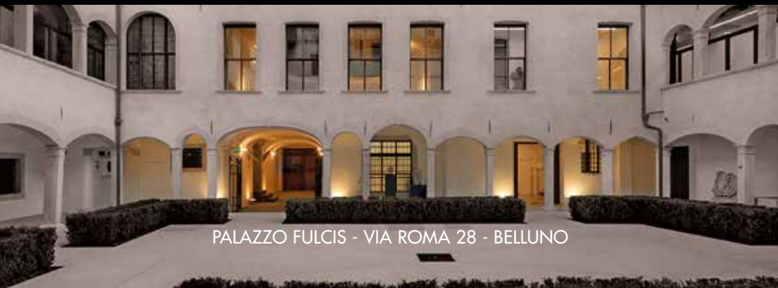
PALAZZO FULCIS - VIA ROMA 28 - BELLUNO